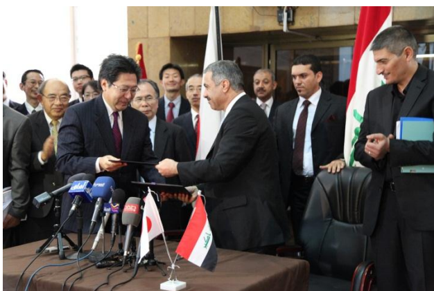
Minutes of Understanding 調印式 左: 経済産業省ヘルスケア産業課 福島課長 右: イラク保健省 ハミース副大臣