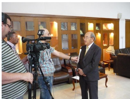
地元テレビ局のインタビュー