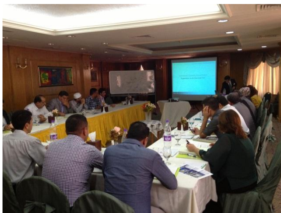
日本人講師による講義