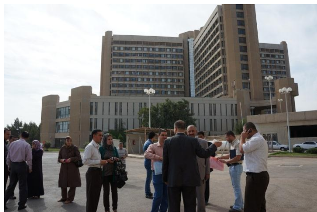
ヨルダンの国立病院の見学